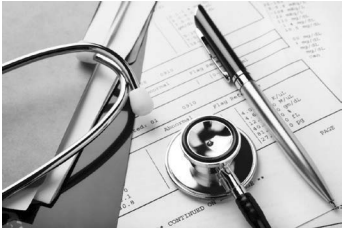
Schéma de Décision